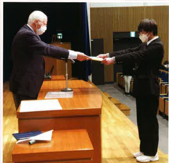
● 茨城キリスト教学園高等学校 ..... インターアクトクラブ